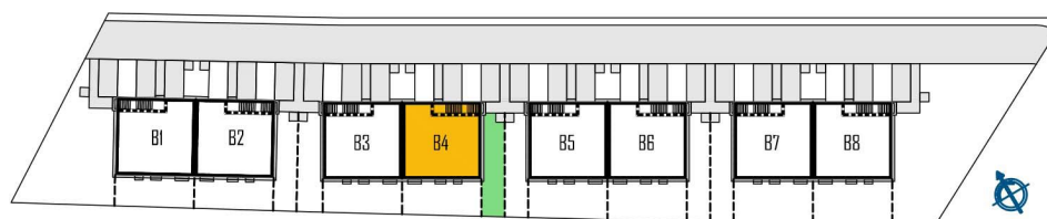
LOKALIZACJA - ETAP 1